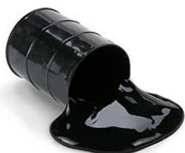
1 baril = 159 litres